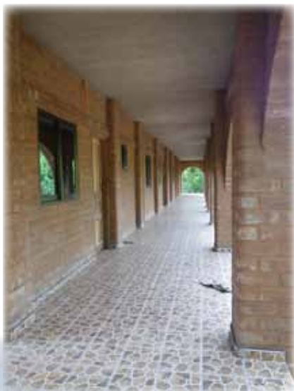
Sous les arches du nouveau bâtiment d'hébergement à Sichem.