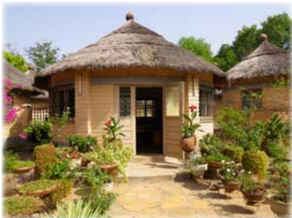
Le centre Cidap de Baga.