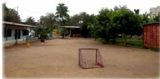
Le site d'hébergement de ANGE à Lomé.

Si vous souhaitez les contacter et les soutenir : asso_ange@yahoo.fr