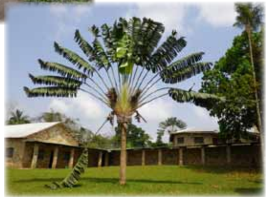
L'arbre du voyageur de l'Abbaye de Dzogbegan.