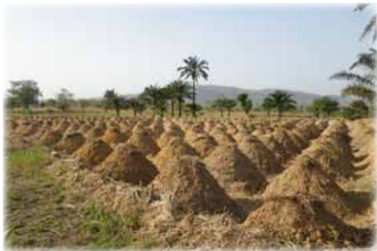
Le Centre Cidap de Natoun.

Si vous souhaitez les contacter : cidap_centre@yahoo.fr