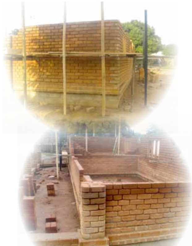
Le chantier de la maison témoin à Lolobo (mars 2011).

Depuis la France, nous vous adressons tous nos vœux de courage et de patience quand à l'amélioration de la situation en Côte d'Ivoire.