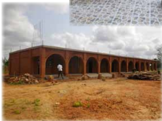
Le chantier du lycée de Djagblé.